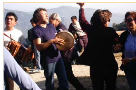
Ταραντέλα στο Γκαλετσιανό