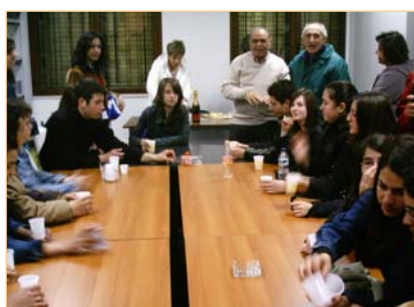
Στο Δημαρχείο του Ριχουδίου