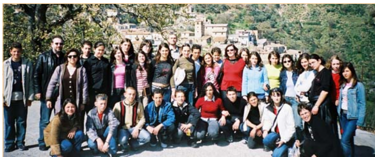
Καλαβρία - Γκαλετσιανό

Επιστροφή στη Barcellona Pozzo Di Gotto, τελευταίο βράδυ, καιρός για το ξακουστό ιταλικό παγωτό και μια τελευταία βόλτα στο θαυμάσιο Millazzo.